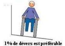
1% de dévers est préférable