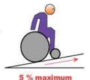
5 % maximum

Toute dénivellation importante peut être franchie par un plan incliné dont la pente doit être la plus faible possible et inférieure à 5%. Si elle dépasse 4% en cheminement continu, il faut un palier de repos tous les 10 mètres. En cas d'impossibilité technique liée à la topographie, ou à des constructions existantes, une pente peut toutefois aller jusqu'à 8% sur une longueur de 2 m maximum et jusqu'à 12% sur 0,50 m maximum.